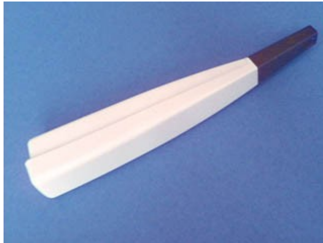
Allume-gaz avant modification

Il faut enlever la pièce métallique qui se trouve à l'avant, elle ne sera pas remontée.